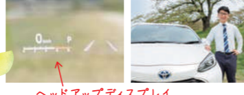
ヘッドアップディスプレイ

Q4 こんなオプション付けました！このオプション付けてよかった！ A4 オプションでヘッドアップディスプレイを付けました。フロントガラスに速度や標識、ナビで目的地セットをしているとどこで曲がるのか表示されて視線の移動が少なくなるところが良い！