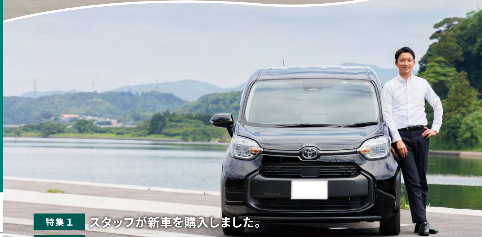
撮影地：松江市 大橋川沿い