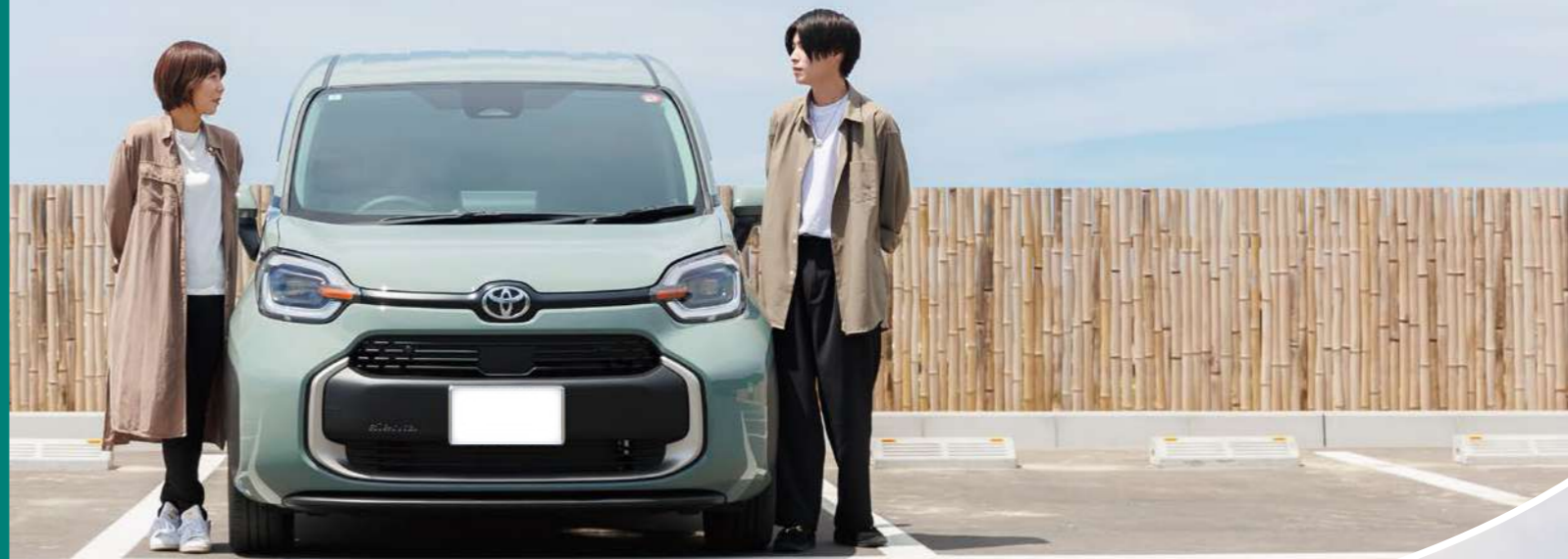
撮影地：出雲市 稲佐の浜